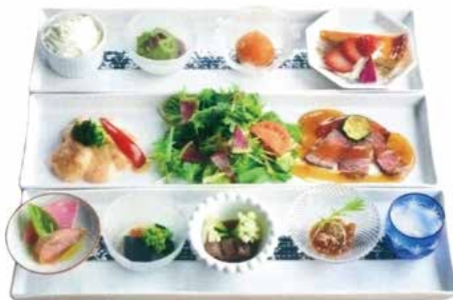
昼膳(ランチデザート付き) 1600円。オードブル、スープ、メインプレート(魚、肉)