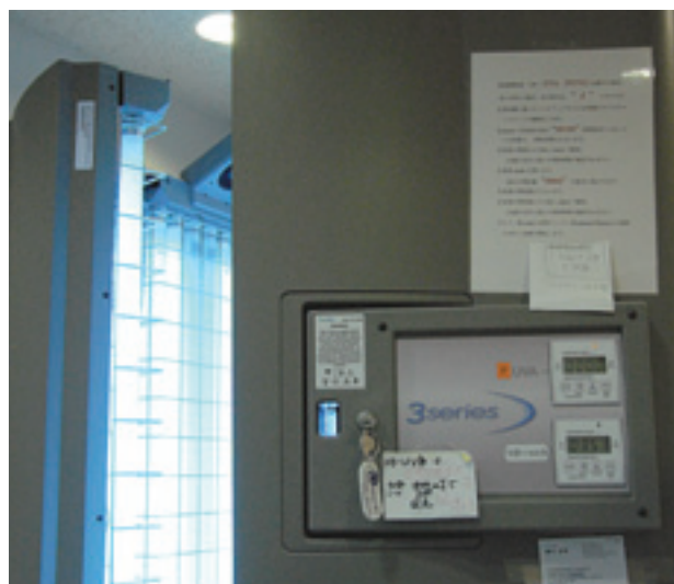
多用途紫外線照射装置 (全身照射型)

最近では、このような面倒な前処置をしなくとも、一番治療効果の高い紫外線のごく狭い波長だけを用いるナローバンド紫外線も頻用します。その他、掌蹠膿疱症や難治の手アトといった手足専用の照射機もあります。