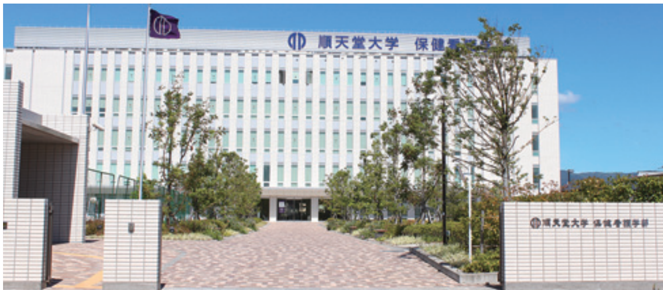
(順天堂大学保健看護学部 三島キャンパス)